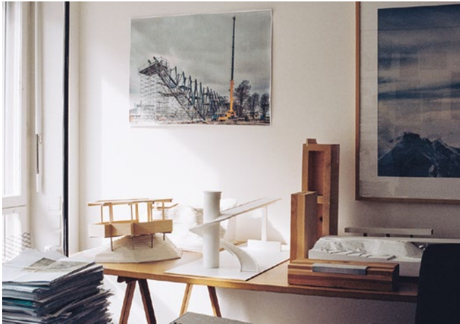
Dans les murs du bureau Conzett Bronzini Partner AG