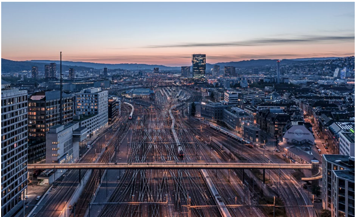
La passerelle Negrelli par-dessus les voies de la gare centrale de Zurich