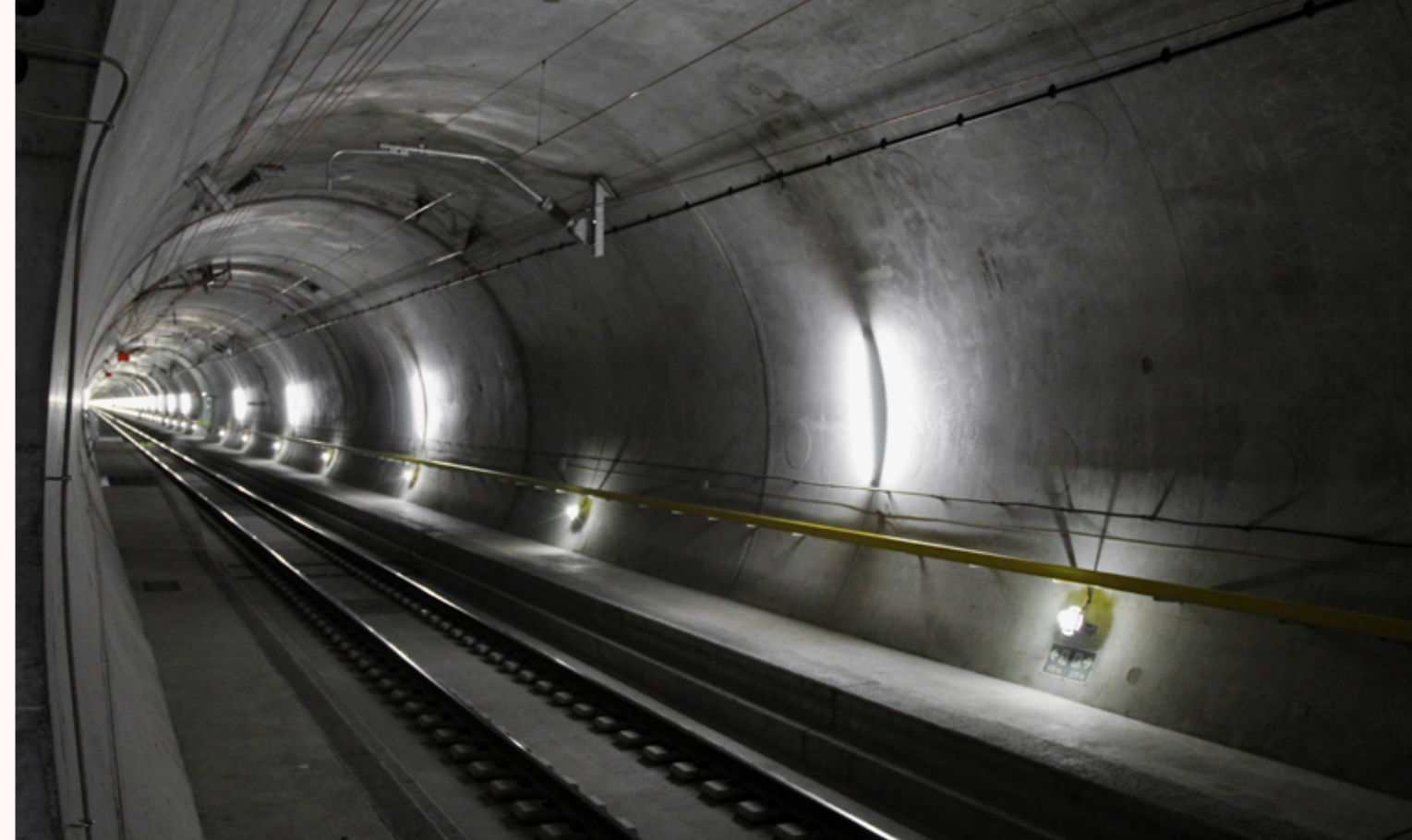
Blick in den betriebsbereiten Teil des Gotthard-Basistunnels.