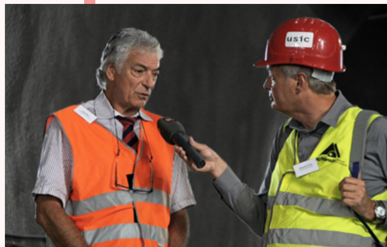
USIC-Präsident Heinz Marti stellt sich den Fragen eines Journalisten.

im starken Widerspruch zur öffentlichen Wahrnehmung. In diesem Sinne erlaubte der von der usic organisierte Medientag nicht nur eine willkommene und interessante Einsicht in einen sonst zumeist verborgenen Tätigkeitsbereich, sondern offenbarte auch die Notwendigkeit einer proaktiven Kommunikation gegenüber einer breiten Öffentlichkeit, um der Bedeutung des Ingenieurberufs gerecht zu werden. ■