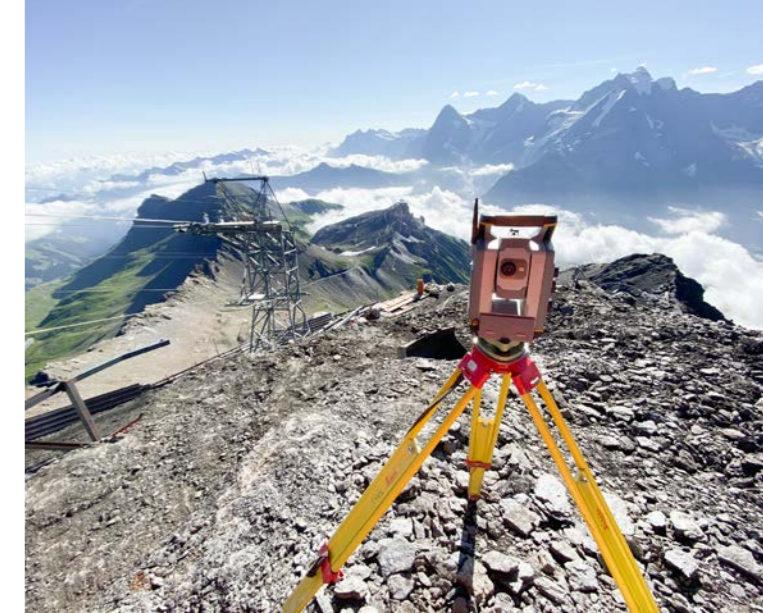
Neubau Schilthornbahn 20XX. Leistungen b+d: Bauabsteckungen, Kontroll- und Überwachungsmessungen