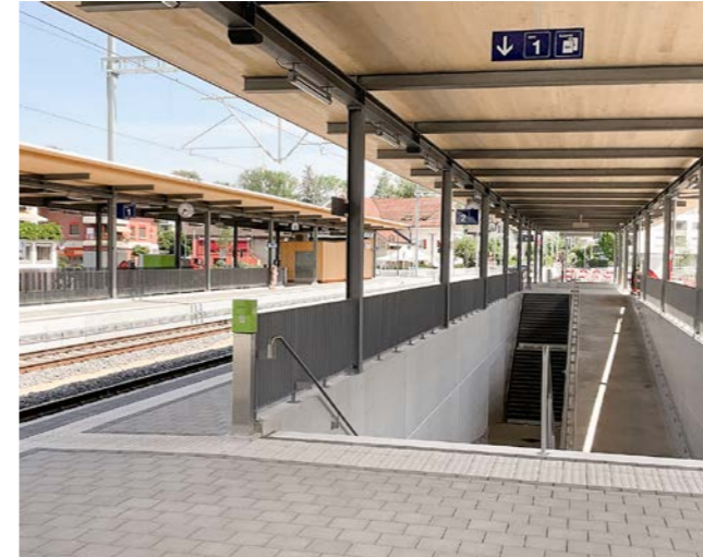
Umbau Bahnhof Kirchberg-Alchenflüh. Leistungen b+d: Gesamtplaner und Fachplaner Phasen 31–53, Bauleitung, Überwachungsmessungen

b+d ingenieure ag Höchhusweg 6, 3612 Steffisburg, Hobachergässli 1, 3800 Matten www.bd-ing.ch