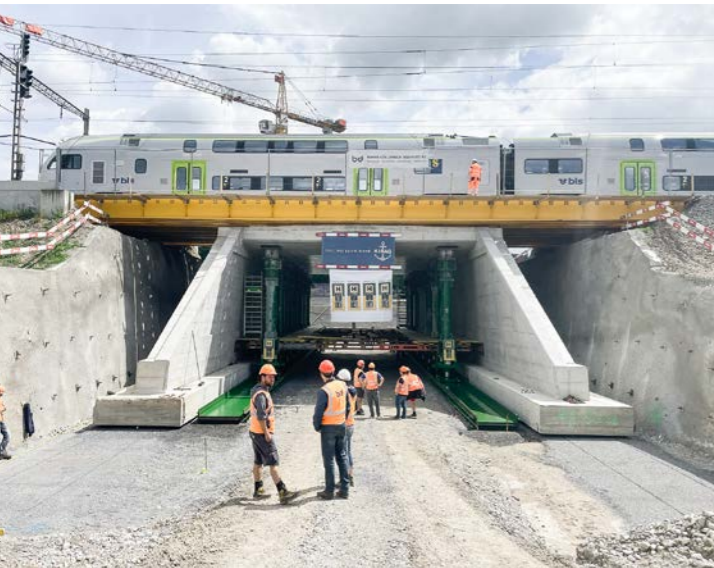
Neue Entlastungsstrasse Nord, Münsingen. Einschub neue Unterführung unter Bahntrasse. Leistungen b+d: Gesamtplaner und Fachplaner Phasen 31–53, Bauleitung, Bauvermessung, Monitoring Baugrube

Die b+d ingenieure ag feiert im Jahr 2024 ihr 40-jähriges Bestehen. Die Unternehmung gehört dank ihrer kontinuierlichen Weiterentwicklung der Geschäftsfelder und der Innovationskraft zu den führenden Anbietern von Ingenieurdienstleistungen im Berner Oberland. Der Erfolg beruht ebenso auf dem Engagement des gesamten Teams in den einzelnen Projekten, der umfassenden Beratertätigkeit zugunsten der Bauherrschaften sowie dem kompetenten Auftritt der Mitarbeitenden.