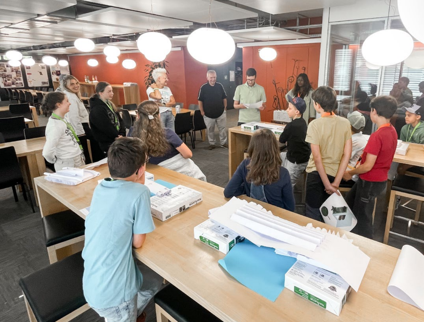
Annnonce des résultats du concours de construction de ponts