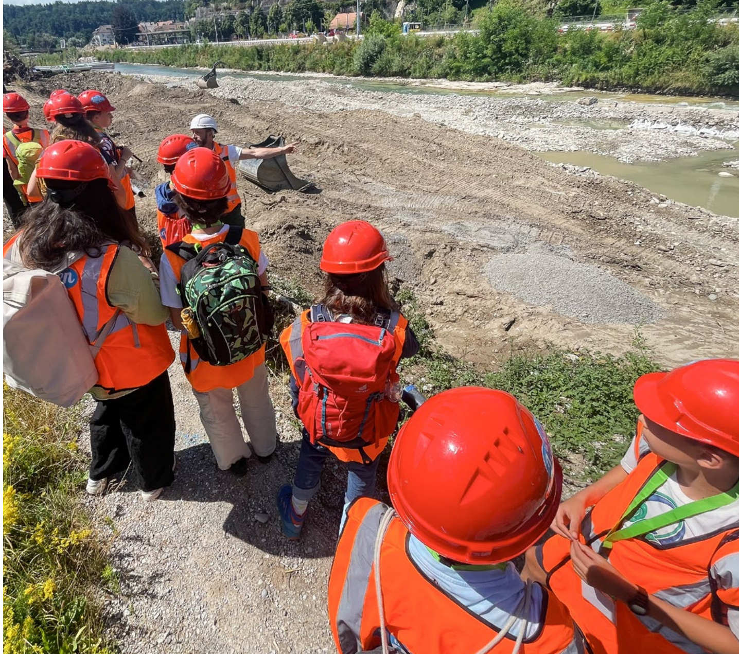
Les enfants à la découverte de la protection contre les crues