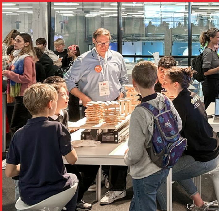
Faszination Rütteltisch: Bauten im Erdbeben-Test

Vom 25. April bis 4. Mai 2025 präsentierte sich suisse.ing an der tunBern, der MINT-Erlebnisschau für Kinder und Jugendliche im Alter von 6 bis 13 Jahren, auf dem BERNEXPO-Gelände in Bern. Die Veranstaltung bot über 40 interaktive Experimente, um junge Besucher für Mathematik, Informatik, Naturwissenschaften und Technik zu begeistern.