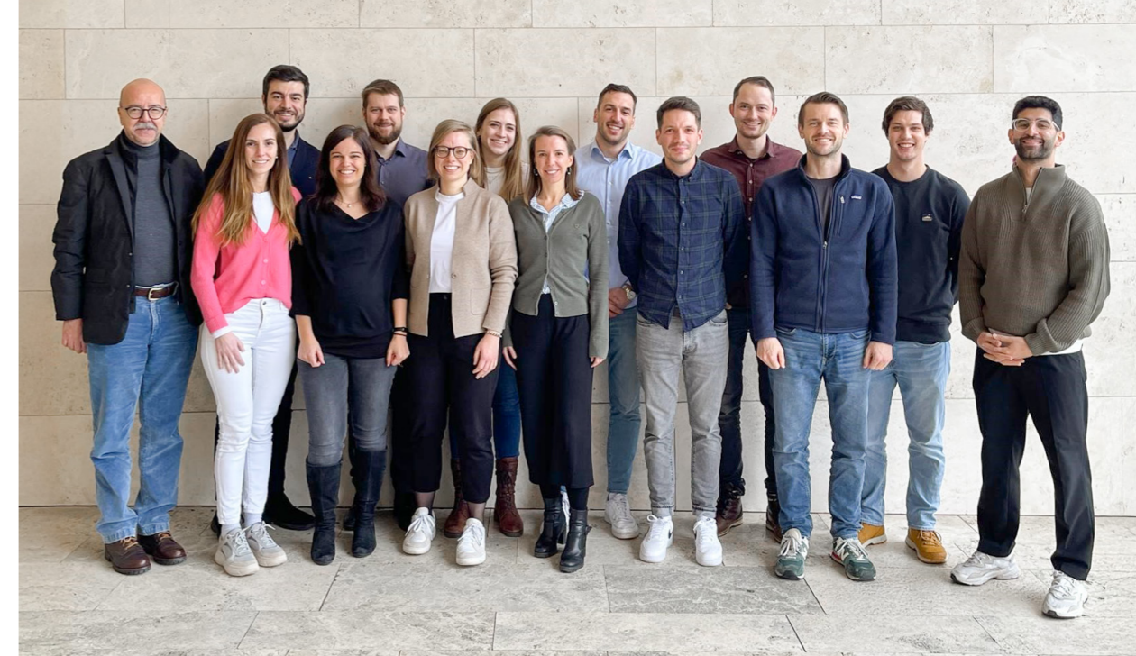
Erste Abschlussklasse Januar 2026. Ein bedeutender Meilenstein für alle Beteiligten!

Innerhalb von 18 Monaten wurde das CAS aufgebaut, was eine intensive Zusammenarbeit zwischen den Partnerorganisationen und den Dozierenden der ETH Zürich und EPFL erforderte. Der erste Durchgang fand im Herbstsemester 2025 statt. Insgesamt konnten 14 berufstätige Teilnehmende aufgenommen werden. Die Teilnehmenden, die über Berufserfahrung bei Bauherrschaften, Planern und ausführenden Unternehmen verfügen, profitierten vom gegenseitigen Austausch und von gemeinsamen, praxisnahen Übungen in gemischten Gruppen. Der Fokus lag auf wirkungsvollen und zielgruppenorientierten Präsentationstechniken. Zusätzlich wurde kontinuierlich Input von Behörden, Fachspezialisten, Forschung und Entwicklung in das Programm integriert. Das Programm wird von erfahrenen Dozierenden aus Praxis, Lehre und Industrie geleitet und bietet den Teilnehmenden wertvolle Einblicke sowie praxisorientierte Lösungsansätze.